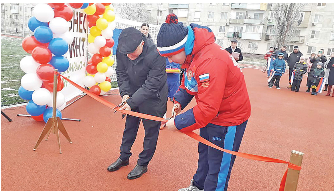
Торжественная церемония открытия «умной» спортивной площадки состоялась 23 декабря в микрорайоне ДОС г. Моздока. Объект создавался по федеральному проекту «Бизнес-спринт (Я выбираю спорт)» нацпроекта «Демография».